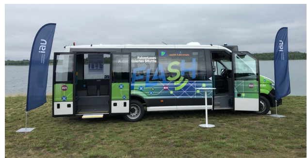
FLASH – FahrerLoses Automatisiertes SHuttle

Realisierter Kleinbus als Folgeaktivität des Förderpreises