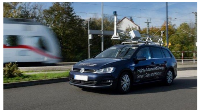
Versuchsträger am Bahnhof Rackwitz, der durch die untergebrachte Sensorik in einem Dachaufbau die Position dieser in einem Kleinbus simuliert und das Umfeld erfasst.